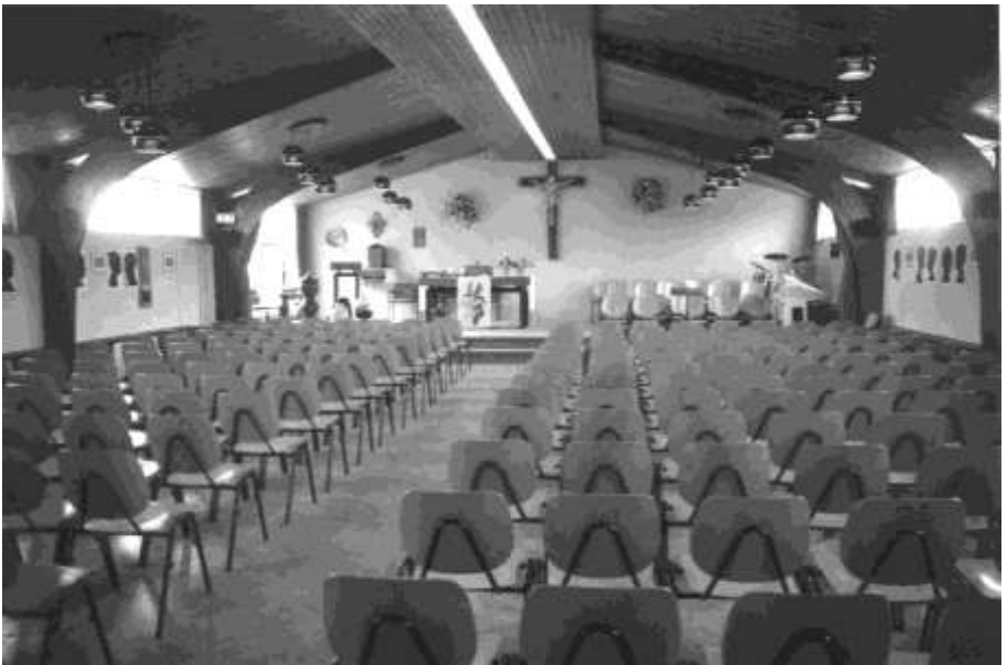
Het interieur van de kerk in 2002