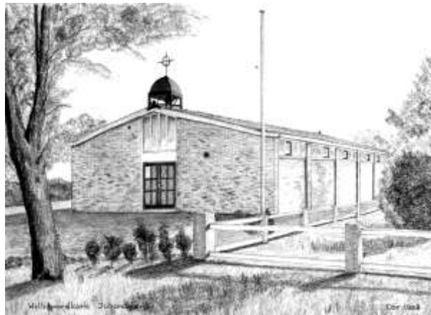
De Willibrordkerk in Julianadorp

De Willibrordkerk maakt samen met de Petrus en Pauluskerk deel uit van de Parochie, Heilige Maria Sterre der Zee.