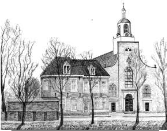
De Petrus en Pauluskerk in oud Den Helder

De Willibrordkerk maakt samen met de Petrus en Pauluskerk deel uit van de Parochie, Heilige Maria Sterre der Zee.