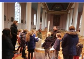
Onze EHC'ers: 't Zand en Den Helder

Petrus en Paulus 11.00 uur eucharistieviering I. Garcia Inzingkoor