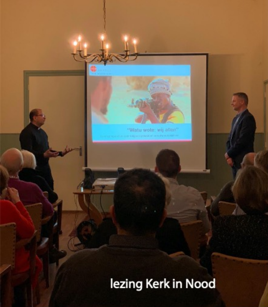
lezing Kerk in Nood