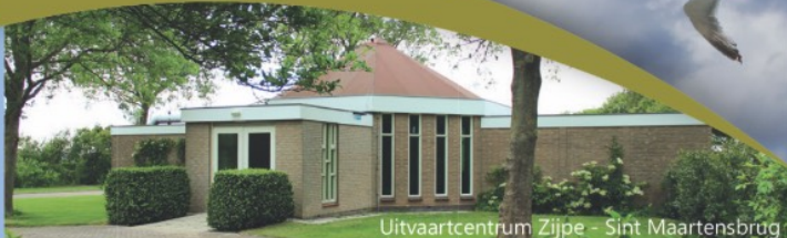
Uitvaartcentrum Zijpe - Sint Maartensbrug