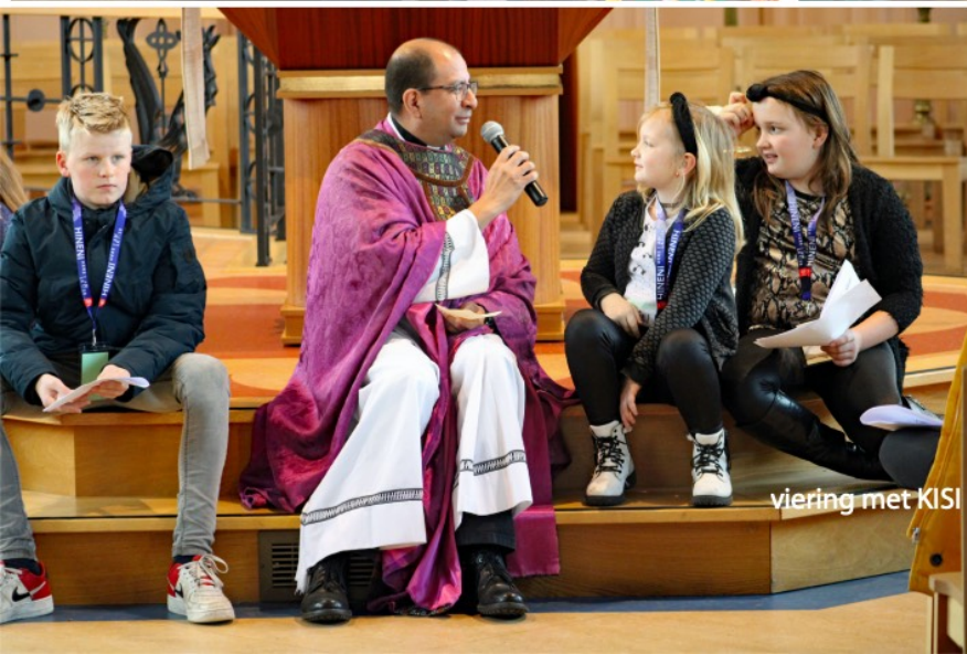
viering met KISI voor Tiger Kids