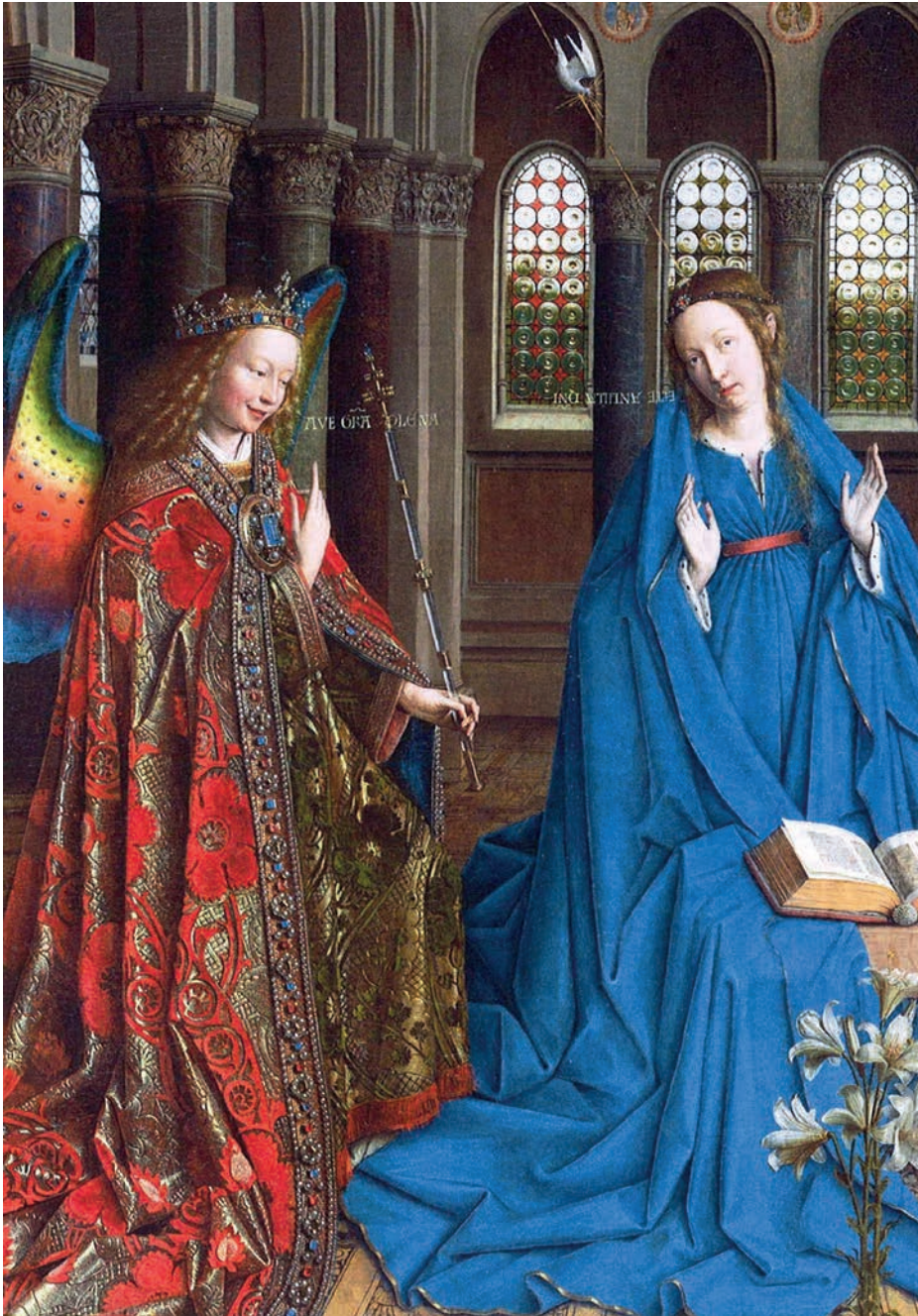
Afbeelding: Jan van Eyck, Annunciatie (detail)