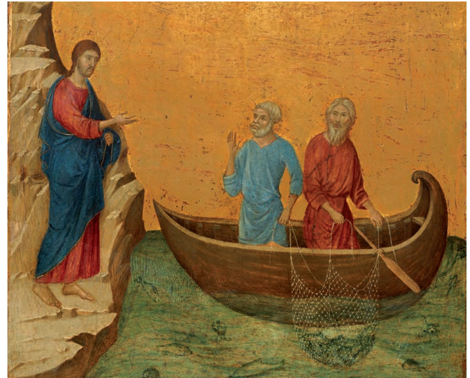
Afbeelding: De roeping van Petrus en Andreas

Wij bidden U om roepingen tot het priesterschap, het diaconaat en het religieuze leven; dat vele mannen en vrouwen uw roepstem mogen horen en in geloof op deze stem mogen antwoorden, tot heil van de wereld en tot lof en eer van uw Naam.