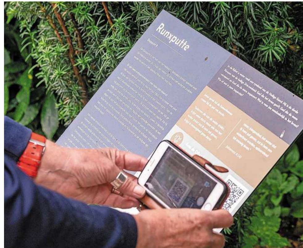
Met de mobil is het eenvoudig om de verhalen op te halen.