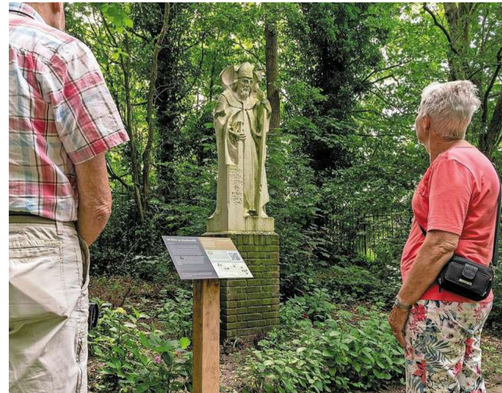
De bordjes staan ook bij een standbeeld van de heilige Willibrordus.